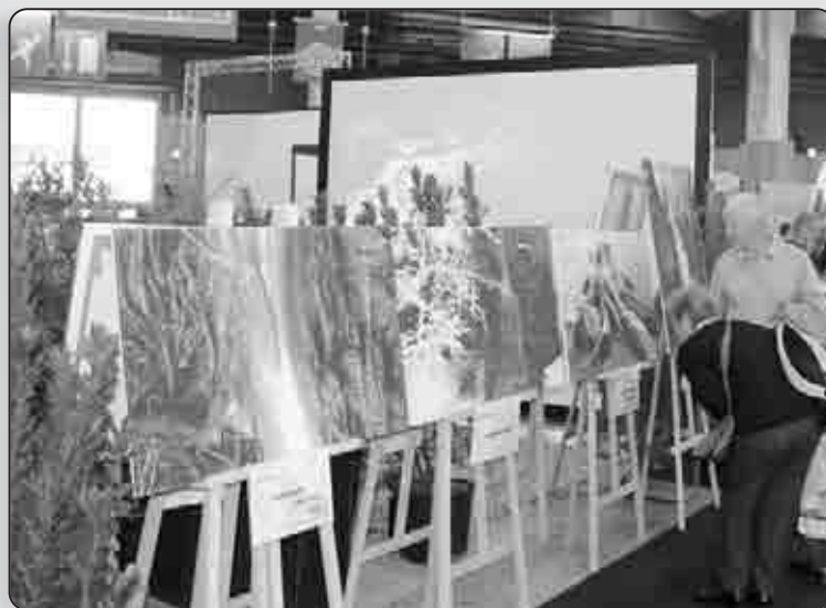
L'expo «Corsica Terra d'Acqua» installée au salon «Destinations Nature», Porte de Versailles

Corsica Terra d'Acqua est composée de 30 panneaux et est présentée sur chevalet d'après les œuvres d'André Ortuno. Elle se décline autour de six thématiques : beautés aquatiques, patrimoine bâti, fragilité de la ressource et des milieux, l'eau source de vie Biodiversité, eau et paysages, loisirs d'eaux vives. A travers l'œil du photographe, cette exposition apparaît comme un excellent vecteur de sensibilisation du public. Elle permet de découvrir l'exceptionnelle richesse du patrimoine aquatique insulaire et fait oeuvre de prévention.