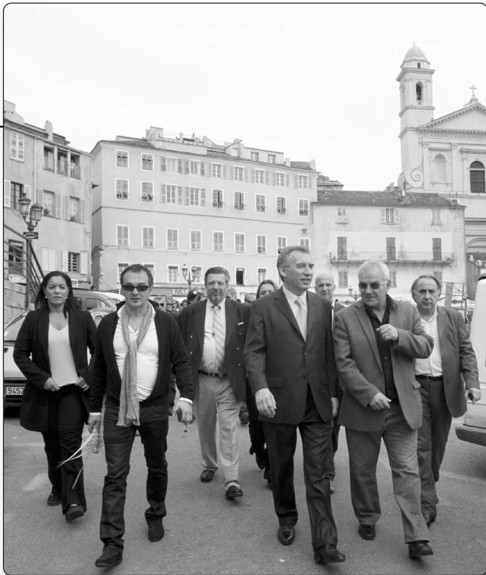
On le dit à un moment critique de sa campagne. Le candidat Bayrou continue d'avancer.

cun des grands problèmes : dette, déficit, emploi, produire français, éducation, moralisation de la vie publique, diversité française...» Sans faire de populisme à la Mélenchon , bien sûr : «Quand on présente des idées qui nient la profondeur de la crise, avec notamment une augmentation de 20% du SMIC, on satisfait certes une partie de l'opinion, mais en fait on la détourne des vrais rendez-vous qu'a à prendre notre pays et qui ne se laisseront pas ignorer.»