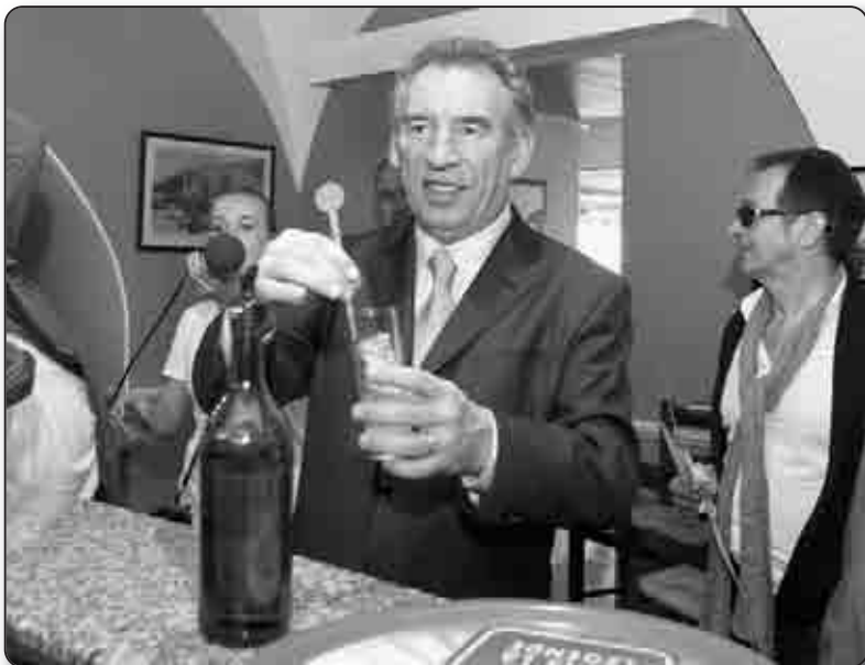
A l'heure de l'apéro au Bar Pigalle, chez Louis Blanc

Le Béarnais , partisan des identités et des langues régionales a sacrifié à la mode anglophone, le temps d'une lecture éclairée, celle d'un titre qui fait autorité. De quoi apporter de l'eau à son moulin et donner son sentiment sur la campagne dont il est partie prenante : «Elle suscite la stupéfaction bien au-delà du territoire français. «The Economist» parle de «campagne frivole» caractérisée par un «déli de réalité». Une première ! De fait, jamais il n'y a eu de distance aussi grande entre les véritables enjeux du pays et ce qu'en disent les candidats puisqu'en fait de ces enjeux ils ne parlent pas !». Et de stigmatiser la «légèreté, le laxisme et la lâcheté avec lesquels PS et UMP gèrent tout ça». La stratégie Bayrou ? «Ne passer à côté d'au-